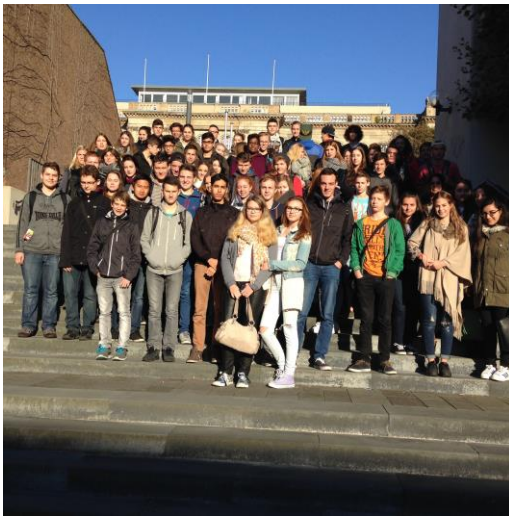
Erstinfotag an der RWTH Aachen 2015