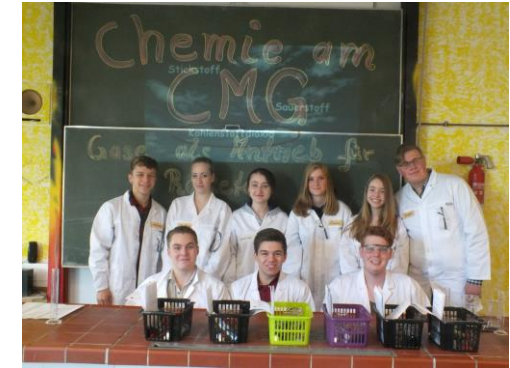
Schülerinnen und Schüler der Q2 begeistern Grundschüler für die Chemie