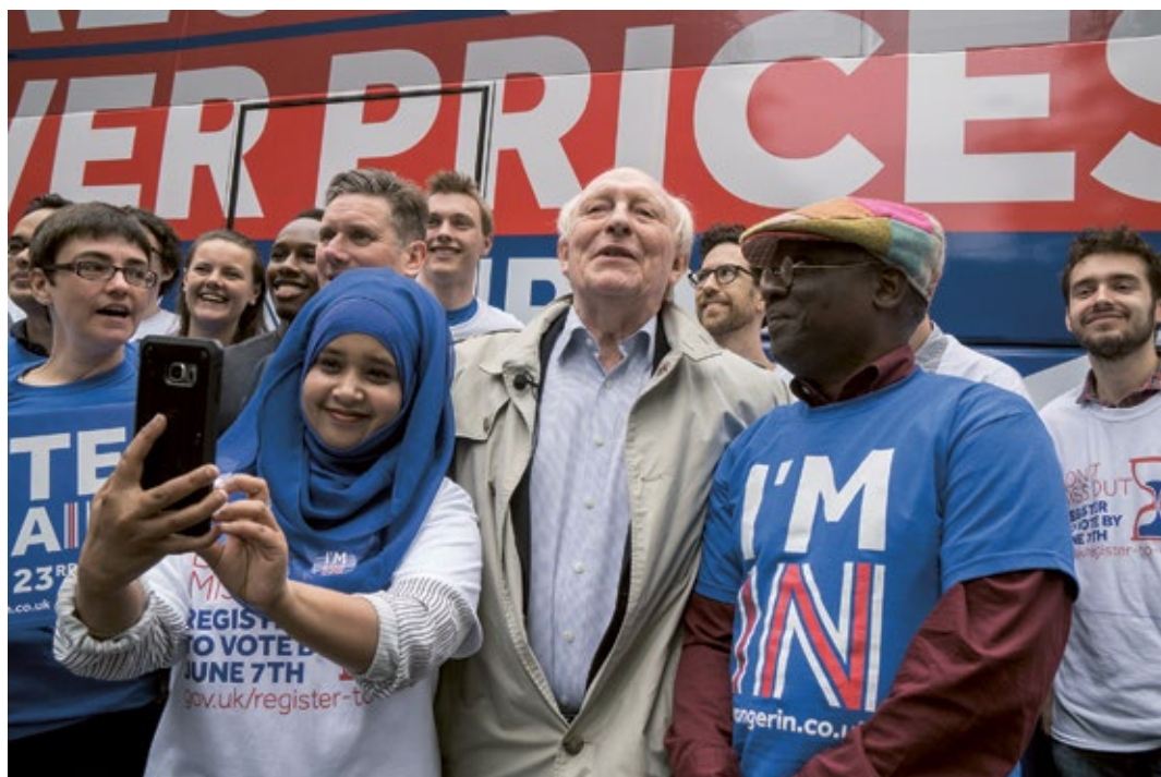
European Union referendum campaign: A rally for the Remain Campaign on the Brexit referendum, London, England, Great Britain