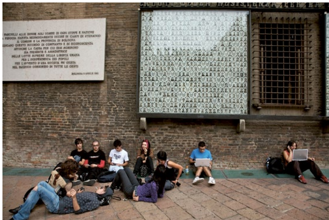
Students at main piazza, Bologna, Italy, 2006