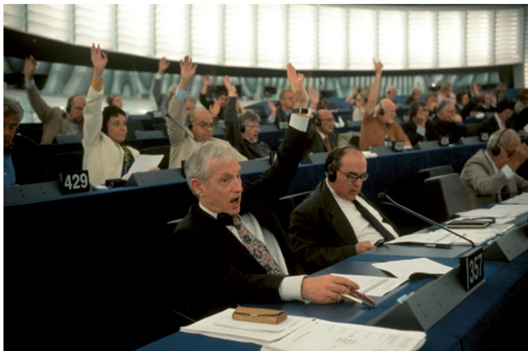
European Parliament in session in Strasbourg, Strasbourg, France