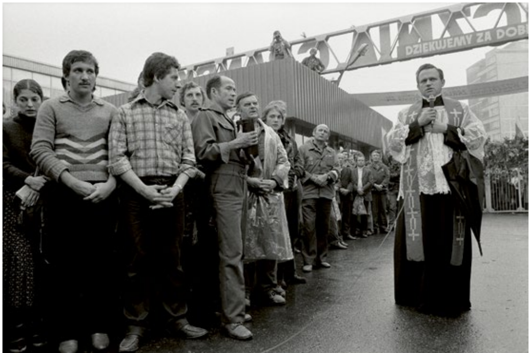
Lenin Shipyard strike, Shipyard workers taking Communion, Gdansk, Poland, 1980