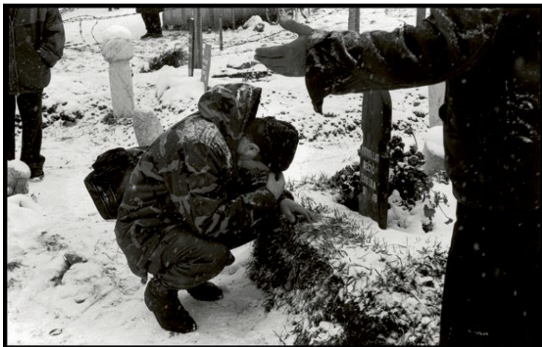
At a muslim cemetery, a Bosnian soldier in uniform prays over the tomb of his young wife, killed by Serbian fire, Sarajevo, Bosnia-Herzegovina, 1993