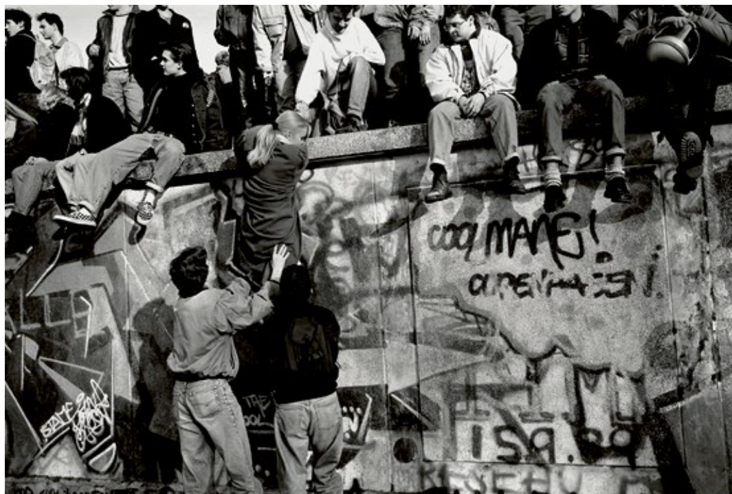
The Fall of the Berlin Wall, Germany, November 10th 1989