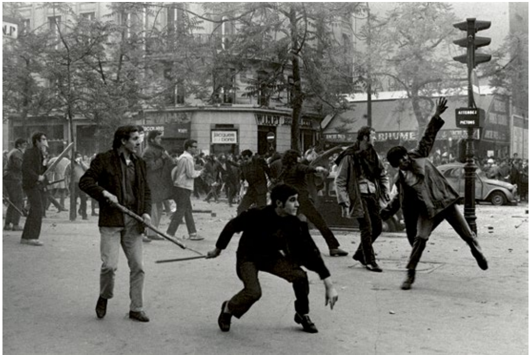
Students hurling projectiles against the police, Boulevard Saint-Germain, Paris, France, May 6th 1968